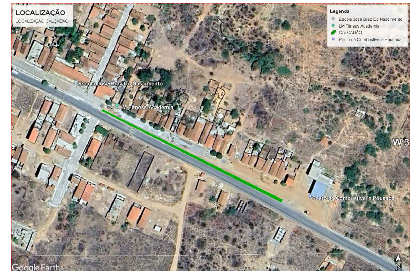
PLANTA DE LOCALIZAÇÃO